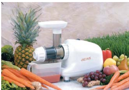
existe aussi en finition chromée