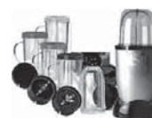
moulin légumes électrique

Vous ne produisez des caviars que rarement, en petites quantités pour des événements ? Un petit moulin légumes à multiples récipients, de type Magic Bullet , à 50 euros fera l'affaire, comme pour une utilisation en petite famille.