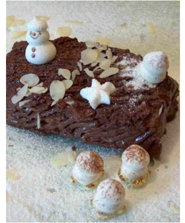
... ou comme chez bibi. Elle est pas belle ma bûche, mais qu'est ce que mon fils s'est amusé...

Depuis onze numéros que nous avons parcouru les bases des desserts pour débutants, nous avons tous les tours de main requis pour réaliser une belle et bonne bûche de Noël. Je m'inspire ici de la recette transmise par Jean-Pierre Coffe pour la Noël 2003 sur France Inter *1 . Je l'ai traduite pour débutants. Réalisez votre oeuvre la veille du grand jour et conservez-la au froid. Dans la recette originale, le chef sert ce dessert avec une Crème Anglaise, dont la recette annoncée comme inratable est publiée dans Cuisine Nature n° 6 (page 2).