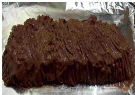
La bûche à ce stade-ci ressemble encore au Klug du Père Noël est une ordure...