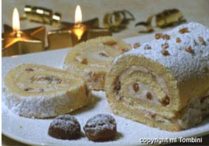
On peut présenter comme chez Odélices.com...

Depuis onze numéros que nous avons parcouru les bases des desserts pour débutants, nous avons tous les tours de main requis pour réaliser une belle et bonne bûche de Noël. Je m'inspire ici de la recette transmise par Jean-Pierre Coffe pour la Noël 2003 sur France Inter *1 . Je l'ai traduite pour débutants. Réalisez votre oeuvre la veille du grand jour et conservez-la au froid. Dans la recette originale, le chef sert ce dessert avec une Crème Anglaise, dont la recette annoncée comme inratable est publiée dans Cuisine Nature n° 6 (page 2).